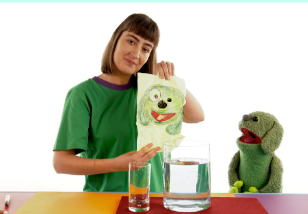
BILD BLEIBT TROCKEN